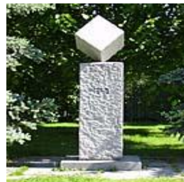
Památník kostce cukru Dačicích

Obyčejná kostka cukru. Jedna z drobností, kterou v současné době