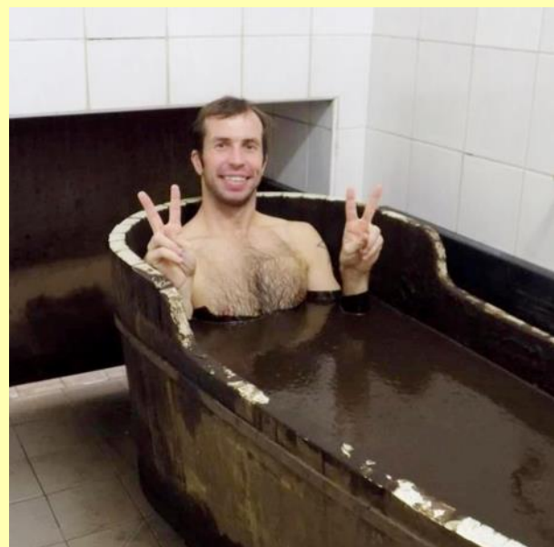
Tenisový šampion Radek Štěpánek v toušeňské slatině, 2016

www.slatinnelaznetousen.cz info 326 993 303