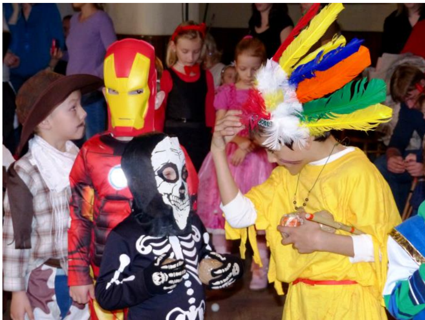
Nastává čas karnevalů (více na straně 12)

Informační zpravodaj městyse Lázně Toušeň