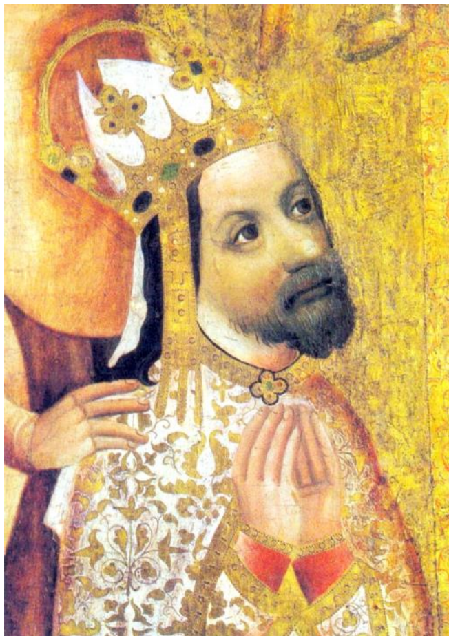
Portrét Karla IV. v detailu votivního obrazu arcibiskupa Jana Očka z Vlašimi, dílo českého mistra kolem roku 1370 ( Národní galerie Praha )

700. výročí narození Karla IV. (*14. května 1316 v Praze) oslovuje širokou veřejnost a mohlo by pro ni být i příležitostí k úvaze nad řadou palčivých otázek současnosti: vždyť naše přítomnost je jen odrazem toho, jak jsme naložili s duchovním a politickým odkazem vlastní historické tradice, jejíž základy položili svatí Cyril a Metoděj, svatá Ludmila a svatý Václav. Tradice křesťanských panovníků v naší historii trvala deset z jedenácti století. Poslední z nich, blahoslavený Karel I. , jehož jsme v našem polabském kraji svého času dobře znali, nastoupil na trůn českých králů právě před 100 lety (1916).