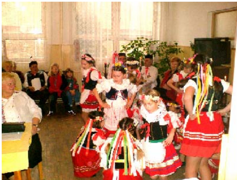
Z vystoupení školních žáků v Domě seniorů U Byšických

Základní školu čeká ještě letos dovybavení nábytkem, vymalování zbytku školy, dovybavení tělocvičny, rozšíření stávající počítačové sítě a v případě přebytku peněz ještě možná něco navíc. Na tomto místě bych rád poznamenal, že podpora OÚ Lázně Toušeň patří k těm nadstandardním, o čemž se opět můžete přesvědčit i v inspekční zprávě České školní inspekce, která nás navštívila ve dnech 2. - 3. března 2006. Ještě jednou mnoho díky Obecnímu úřadu Lázně Toušeň za přízeň, kterou věnuje organizaci ZŠ a MŠ Lázně Toušeň!