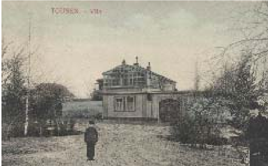
Skleněná vila na pohlednici z počátku 20. století