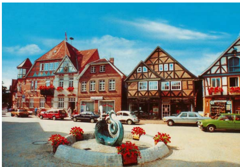
Náměstí v Hitzackeru (pohlednice)